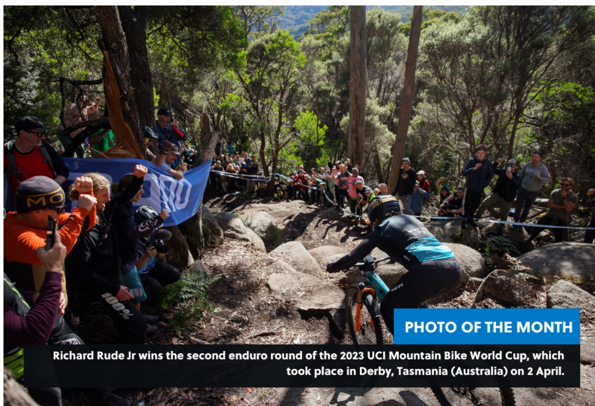
PHOTO OF THE MONTH